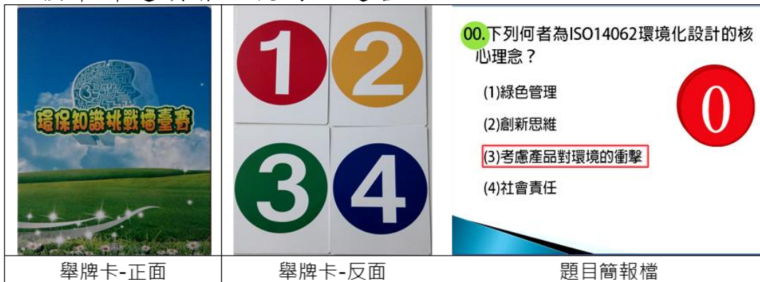
圖 1. PK 賽數字舉牌及題目簡報

十一、司儀宣讀題目後唸出「請準備」，參賽者手持選定牌子但不舉起，待司儀唸出「3、2、1，請舉牌」時，全體參賽者必須同時將牌子舉起至胸前高度，未舉牌或更換舉牌選項者，視同該題答錯。