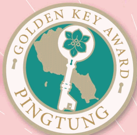
金鑰獎認證 雙人房住宿卷