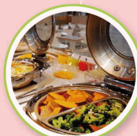
鮭魚大飯店屏東館 平日早餐吃到飽