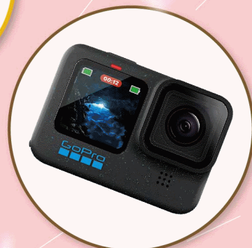
GoPro HERO12 Black 套組