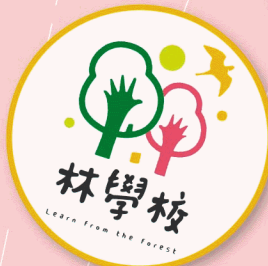
林學校體驗課程套票