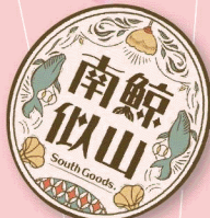
南鯨似山 x 大正浪漫 用餐抵用卷