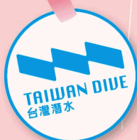
台灣潛水潛水體驗卷