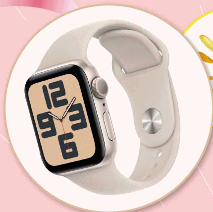
Applewatch SE 40mm